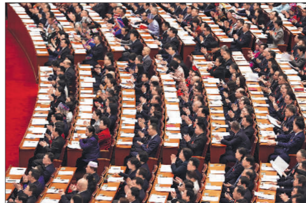
←3月8日,十四届全国人大三次会议在北京人民大会堂举行第二次全体会议。