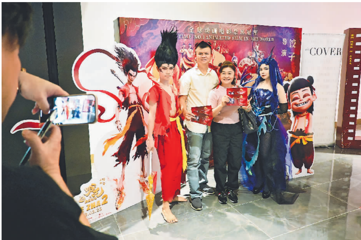
▲近日,观众在马来西亚吉隆坡参加《哪吒之魔童闹海》首映活动。